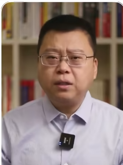
数字经济学者刘兴亮 知识类短视频创作